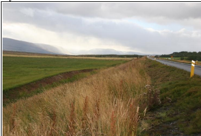
82-01 Vel frágenginn skurður móts við Hvamm.